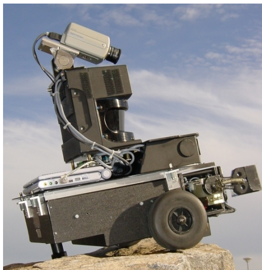
Abbildung 2: Ein Spieler des F2000-Teams CS Freiburg

Wie bringt man nun einer Gruppe von Robotern bei, Fußball zu spielen? Der Reiz dieser Aufgabe liegt darin, dass sehr viele Fähigkeiten erforderlich sind, um gut Fußball zu spielen. Die Aktorik muss schnell genug sein und geeignet sein, mit dem Ball umzugehen. Die Sensorik muss es erlauben, den Ball zuverlässig zu erfassen, die eigene Position auf dem Spielfeld zu bestimmen und die Positionen der Mitspieler und Gegner zu schätzen. In Abbildung 2 ist beispielsweise ein Spieler unseres Teams CS Freiburg zu sehen, der die entsprechenden Hardware-Komponenten besitzt. 2